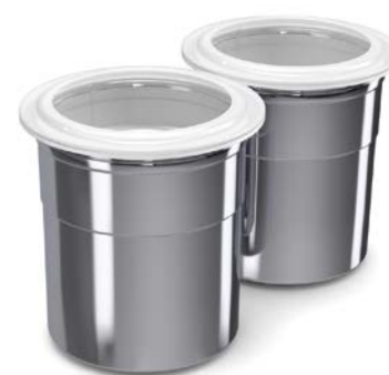
2 contenitori in acciaio cromato con tappo