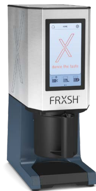
FRXSH Mousse Chef con contenitore di protezione