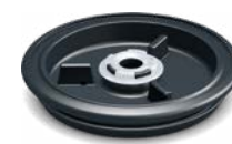
Protezione da spruzzi e anello anti-goccia